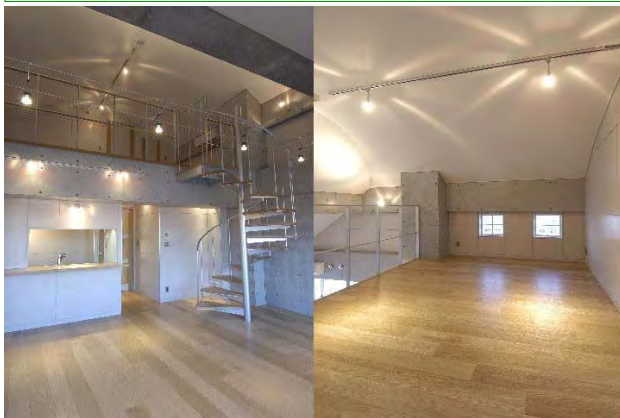
左リビングダイニング、右ワークスペース